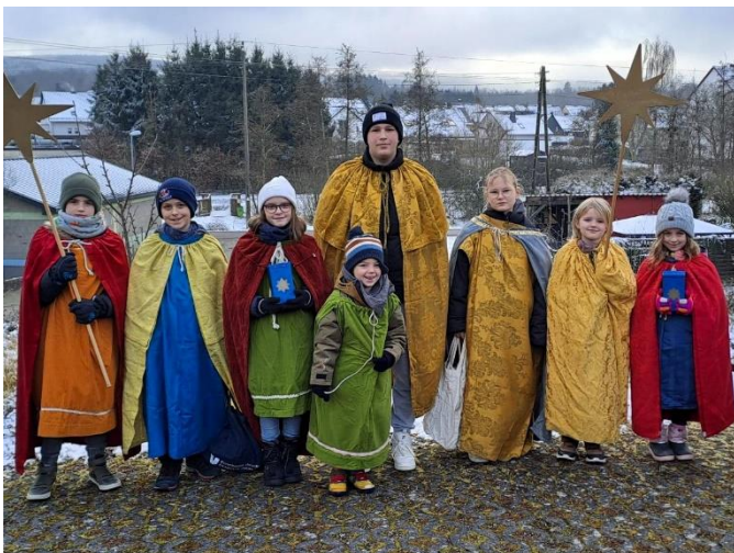
... in Argenthal