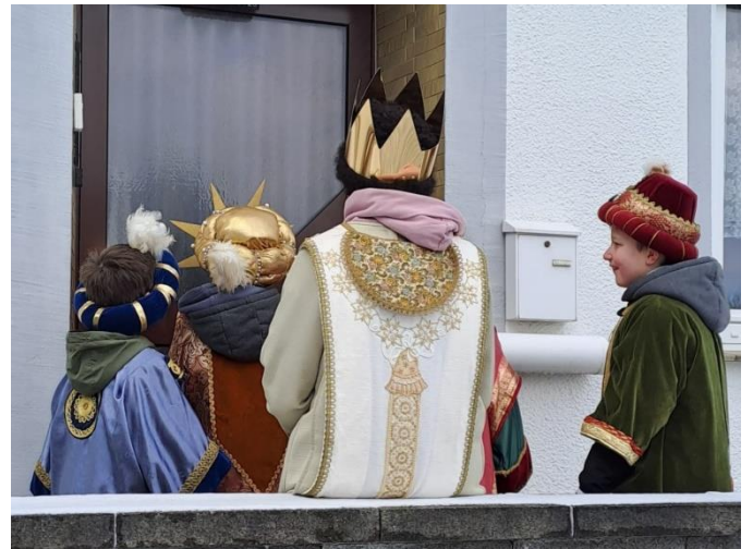
... in Budenbach