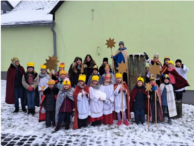
... in Kisselbach