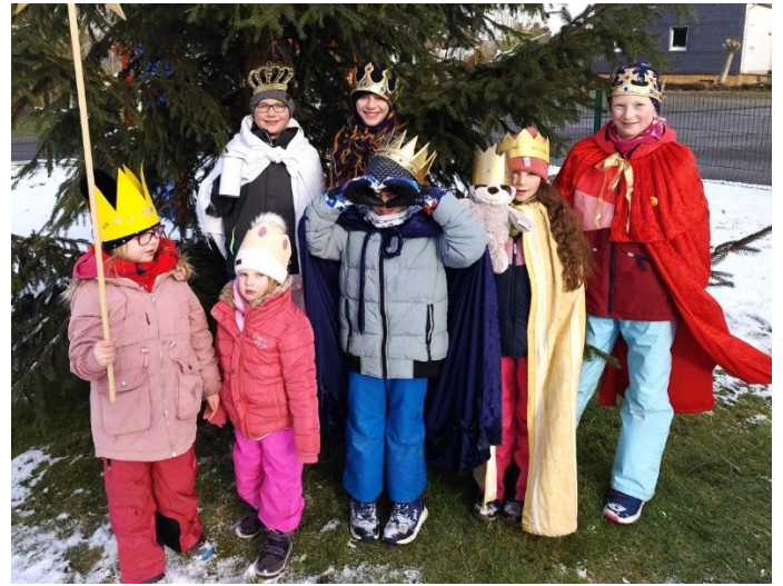
... in Steinbach