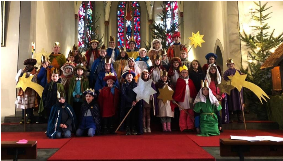
... in Biebern

***** Weitere Informationen, Fotos und auf st.lydia.de Sammelergebnisse im nächsten Pfarrbrief *****