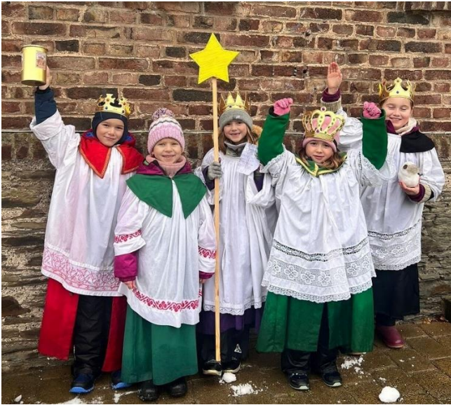
... in Rayerschied