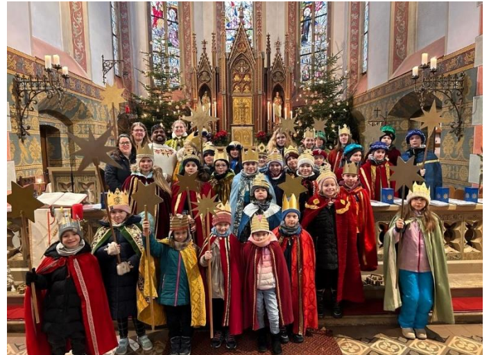
... in Rheinböllen