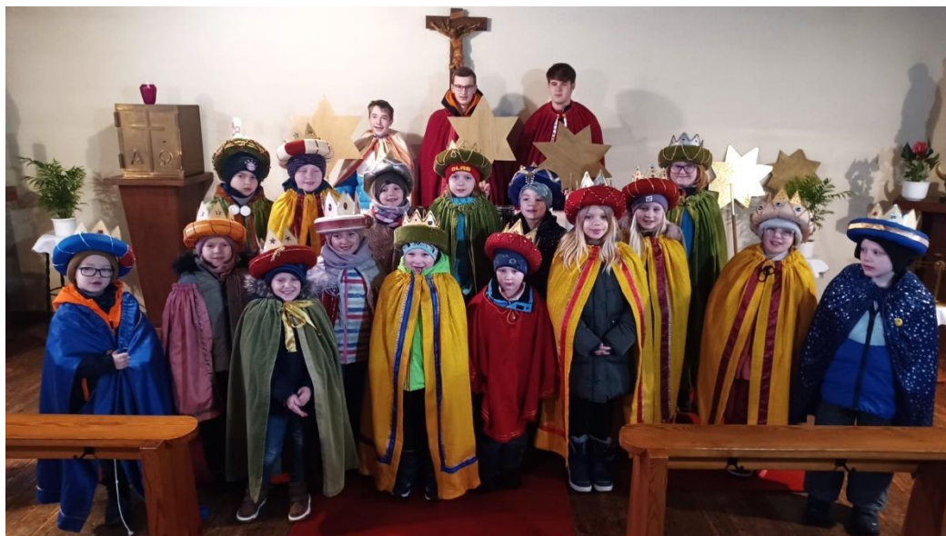
... in Külz und Neuerkirch