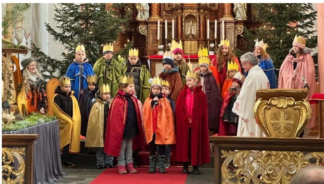
... in Ravengiersburg