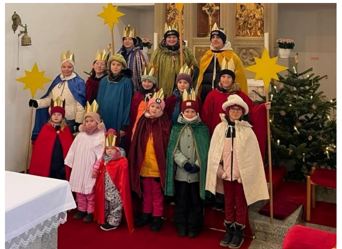
... in Riesweiler