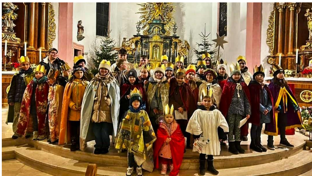
... in Simmern