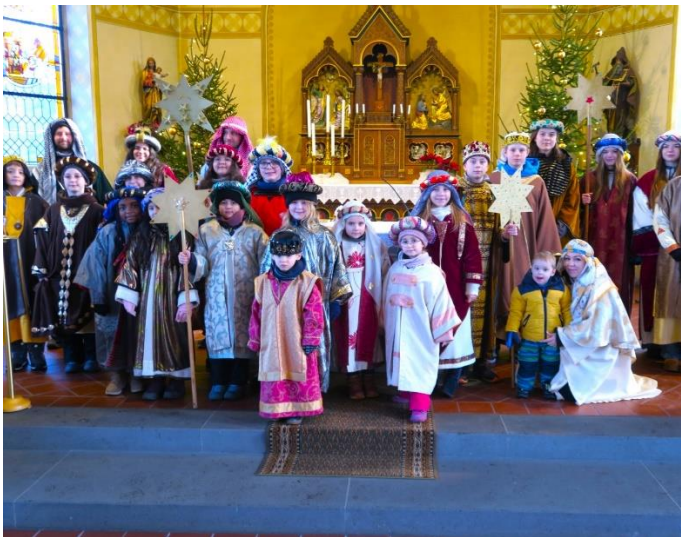
... in Liebshausen