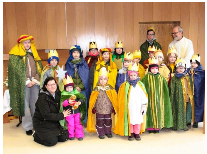
... in Dichtelbach